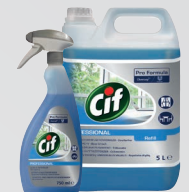
CIF GLAS- & OBERFLÄCHENREINIGER