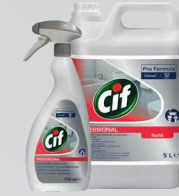
CIF 2IN1 BADREINIGER