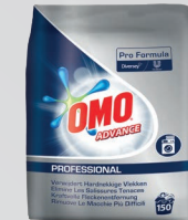
OMO ADVANCE VOLLWASCHMITTEL