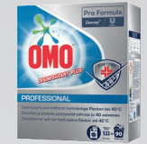
OMO DISINFECTANT PLUS