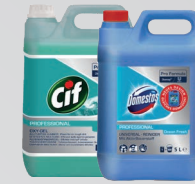
CIF OXY-GEL / DOMESTOS OCEAN FRESH